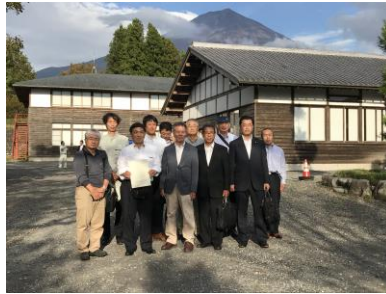
学校法人 富嶽学園 日本建築専門学校