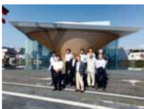
静岡県富士山世界遺産センター