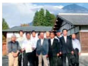
学校法人 富嶽学園 日本建築専門学校

建築分野における著名な建築物と、人材育成施設の視察をテーマに平成30年10月10日、第1回研修会(施設見学会)を実施しました。静岡県富士宮市に2018年竣工した3D-CADを駆使した設計による静岡県富士山世界遺産センターと、学校法人富嶽学園 日本建築専門学校を訪問しました。この学校は木造建築に重点を置いた教育を実施している4年制の専門学校で日本建築の神髄と現代建築技術を習得できる特色ある教育方針による養成施設で、人材育成の課題に対する解決策の一つとして貴重な視察となりました。