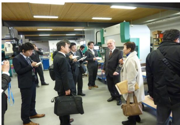
ドイツ、「マンツ バックテヒニーク（有）」 業務用・家庭用オーブンレンジ製造