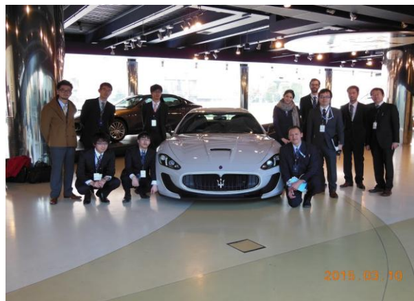
イタリア、「マセラティ社」 自動車・競技車輛製造