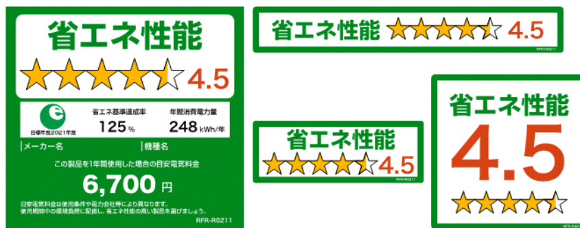
(冷蔵庫のイメージ)