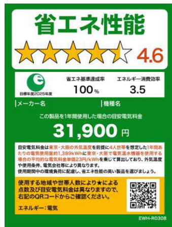
(電気温水機器のイメージ)

※照明器具、テレビジョン受信機、家庭用電気冷蔵庫、家庭用電気冷凍庫、温水機器及び電気便座については、2020年11月及び2021年8月に図5に変更済。今後、家庭用エアコンディショナーについても図5に倣ったものに変更予定。なお、温水機器以外は、製品のサイズやネット取引等の限られたスペースで使用する場合は右側のミニラベルを活用すること。