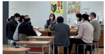
公開訓練（意見交換会）

令和6年2月27日、かなテクカレッジ西部の公開訓練（授業）が実施されました。当日は、58社72名の会員企業が参加し、各コースの実習場や教室にて、訓練の見学や担当指導員との意見交換等行いました。参加者からは「設備が充実していて、専門性を高めるのによい環境だと感じた」、「活気があり、とてもよい雰囲気でした」などの意見がありました。