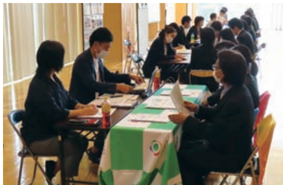
令和5年6月16日（介護福祉分野：45社）