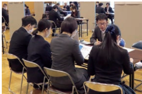
令和5年11月30日（工業・建築技術分野：77社）