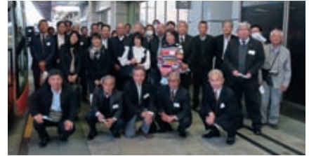
第1回研修会（羽田空港）

また、研修会の後に懇親会も実施され、たくさんの方に参加をいただき、異業種間の交流も行われました。